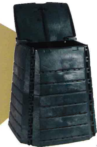
Composteur 390 L