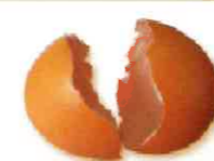
Coquilles d'oeufs broyées