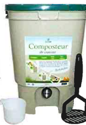
BOKASHI 20 L

Vous pouvez commander VOTRE COMPOSTEUR sur www.sm-sirom-flandre-nord.fr