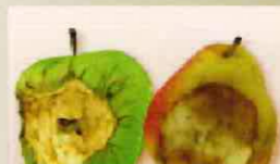
Fruits et légumes abîmés