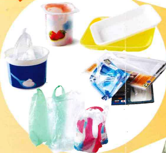
Pots de yaourt, de crème, polystyrènes et barquettes alimentaires, films et suremballages plastiques etc.