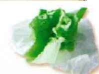
Papiers et cartons souillés