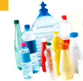
Bouteilles et flacons