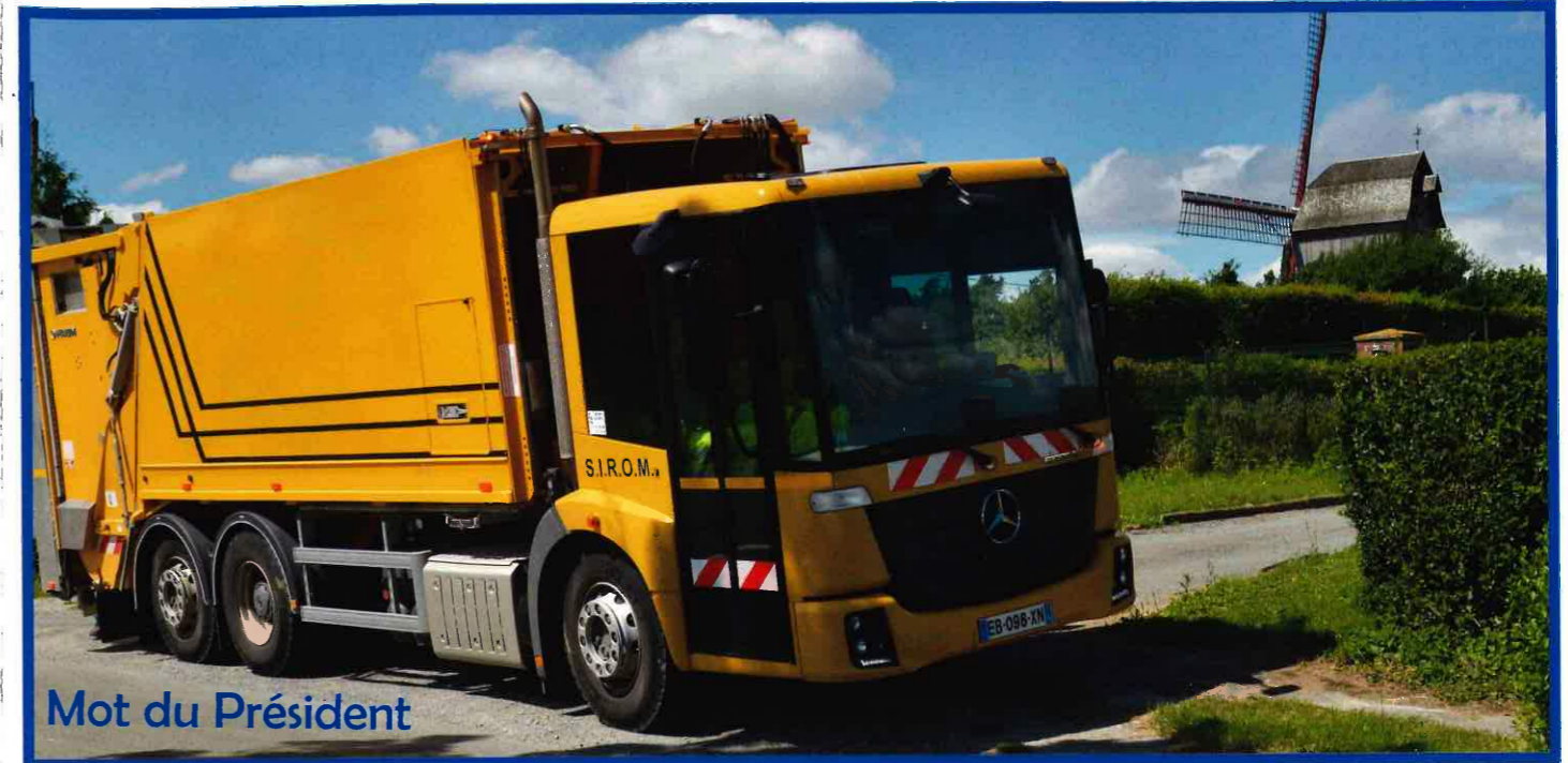
Mot du Président