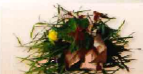
Déchets verts en petite quantité