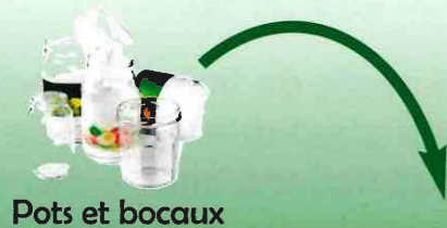
Pots et bocaux