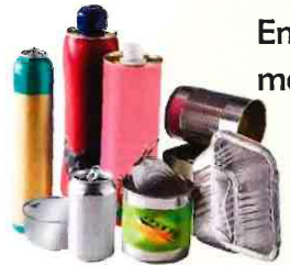
Emballages alimentaires métalliques