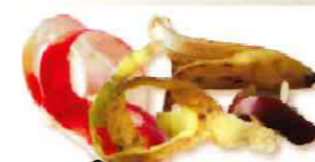
Épluchures de fruits et légumes