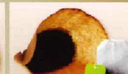
Marc de café et sachets de thé