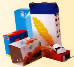
Cartonnettes et briques alimentaires